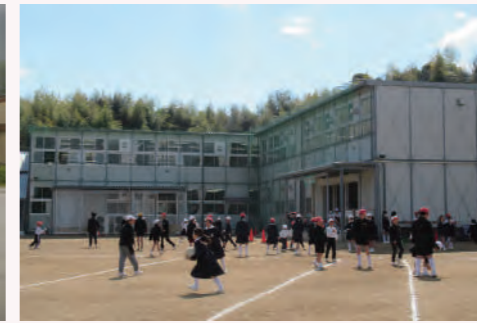
プレハブ校舎 (箭田小学校)