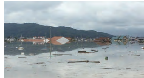
まきびの里保育園