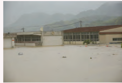
被災した箭田小学校 (2018年7月7日)

川辺小学校、箭田小学校、真備中学校、真備東中学校、真備陵南高等学校、まきび支援学校は浸水により、岡田小学校、菌小学校、二万小学校は浸水は逃れたものの学校が避難所となり校舎を使用できなくなりました。7月9日、10日は学校は休校、その後前倒して夏休みとなり9月3日に再開しました。被災した学校は、仮校舎での授業再開となり、その後、プレハブ校舎を経て本校舎での授業再開までほぼ2年を要しました。本校舎に戻った後も、新型コロナウイルスの感染拡大により学校が休校になりました。