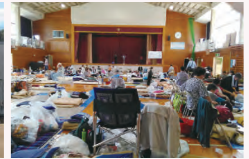
岡田小学校避難所