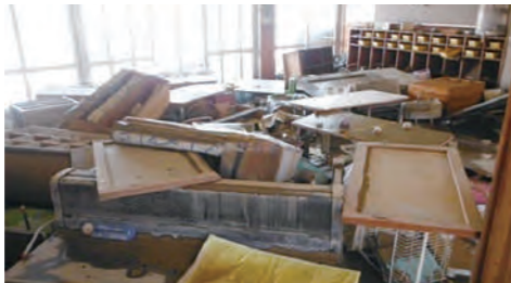
まきびの里保育園の園舎の様子